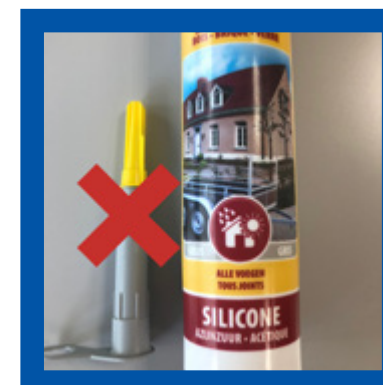
Siliconentubes zonder dop