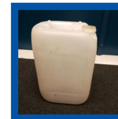
Plastic busen en bidons