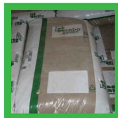
Plastic zakken van zand en keien