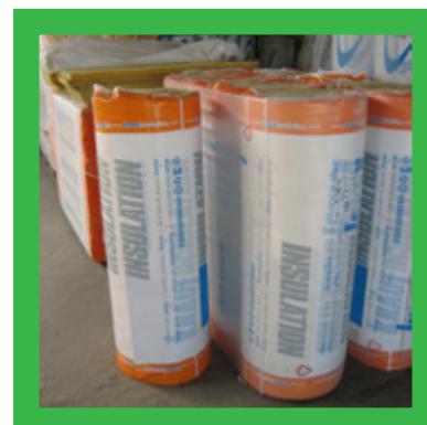
Folie rond isolatiemateriaal