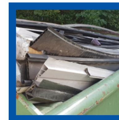
Latmateriaal in pvc