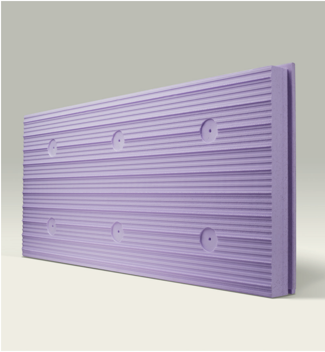
Module steenstrippen 40 mm

Homz Plus is een open systeem met hoogwaardige thermische isolatie van geëxtrudeerd polystyreen (XPS) geschikt voor het plaatsen van steenstrippen van diverse fabrikanten.