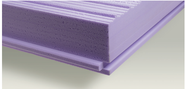
4 zijden tand & groef

De panelen zijn geschikt voor steenstrippen met een hoogte van 40 mm.